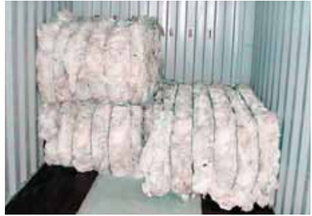
Hleðsla í gáma til útflutnings.