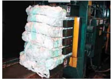
Pressun til útflutnings.