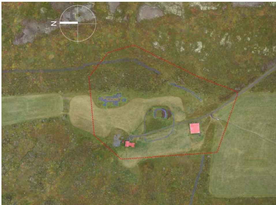
Mynd 1. Afmörkun skipulagssvæðisins (Svarmi 2015)

Skipulagssvæðið er 6.4 ha að stærð og nær niður fyrir íbúðar- og útihús jarðarinnar að vestanverðu, en af gömlum túngarði að sunnan og austan. Norðurmörk skipulagssvæðisins ná um 15 metra út frá minjasvæðinu. Á skipulagssvæðinu eru mannvirki sem tilheyra búsetu og búskap á jörðinni ásamt minjasvæði. Stærsti hluti skipulagssvæðisins er tún og óræktað land.